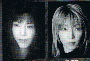
H・アール・カオス H.ART CHAOS(えいち・あーる・かおす)

愛知県/名古屋市/財団法人愛知県文化振興事業団/財団法人名古屋市文化振興事業団/NPO法人世界劇場会議名古屋