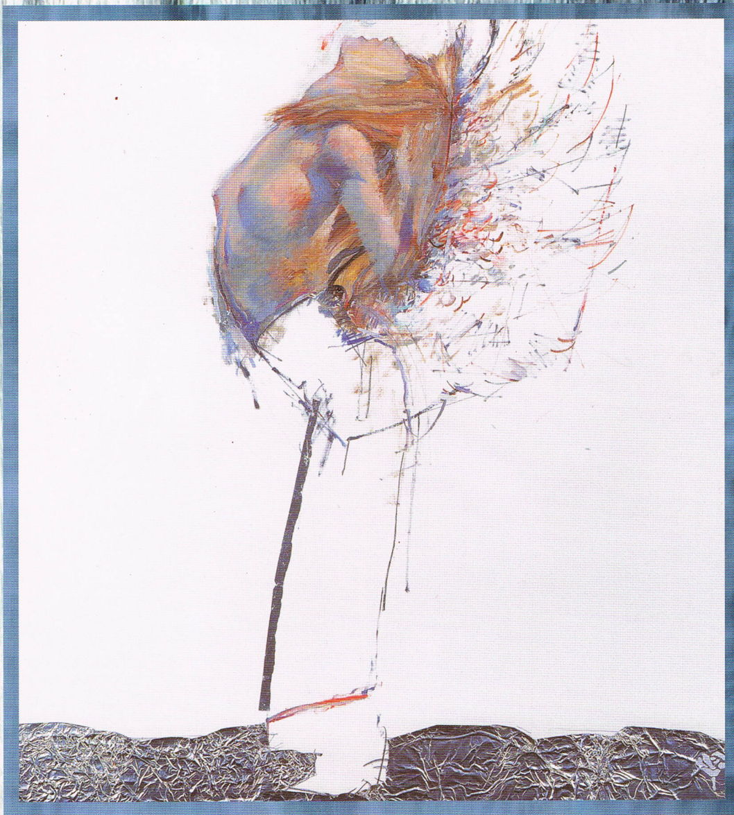
Robert Heindel 2000年 108.5×101 (cm) ミクストメディア 油彩 コラージュ 羊皮紙